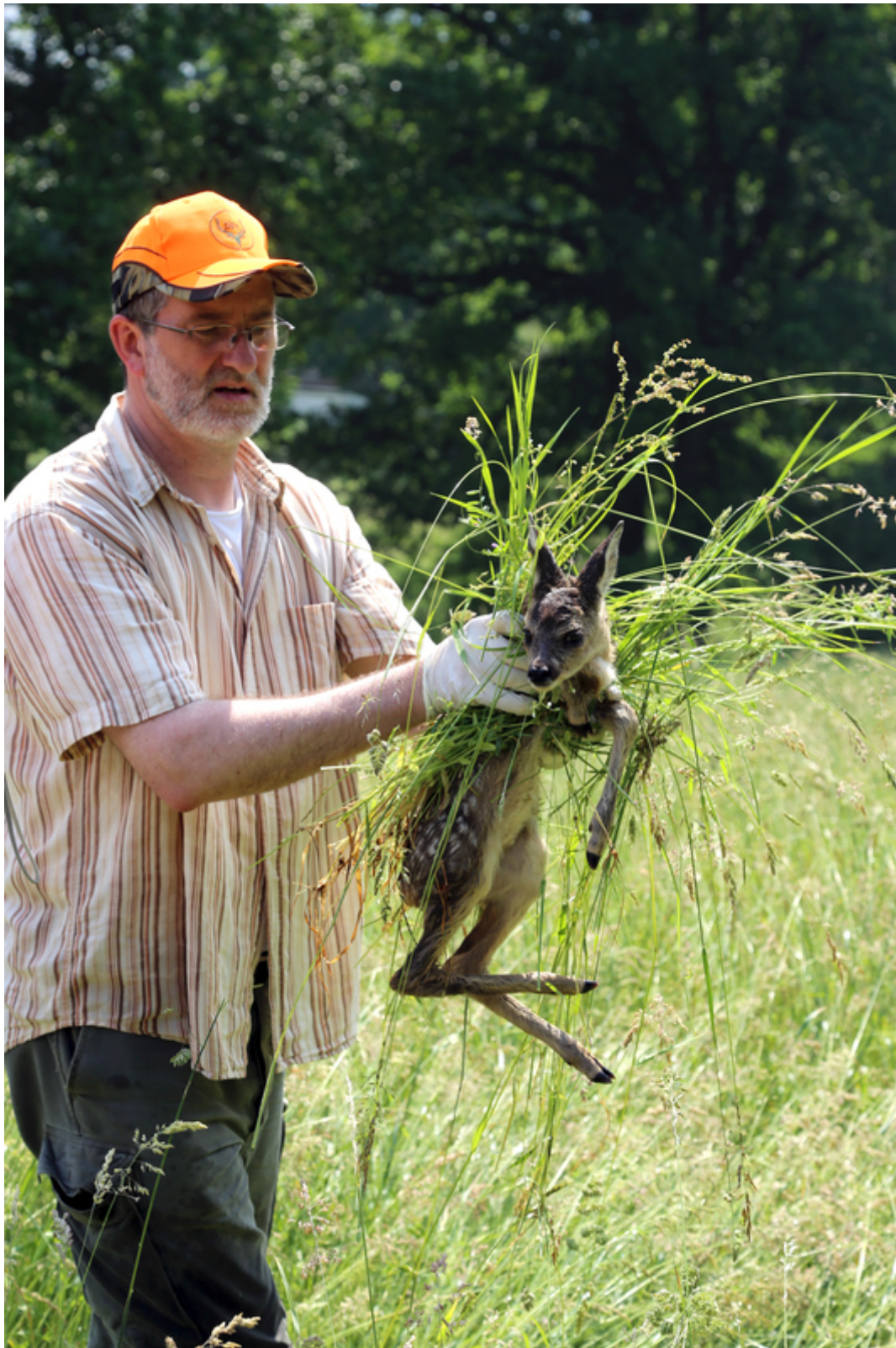
Mit Handschuhen und Grasbett: ein Jäger rettet ein Kitz aus einer Wiese.